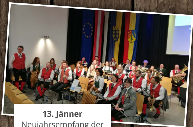
13. Jänner Neujahrsempfang der Gemeinde Bergern