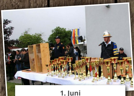
1. Juni Siegerehrung Bezirksfeuerwehr- leistungsbewerb in Geyersberg