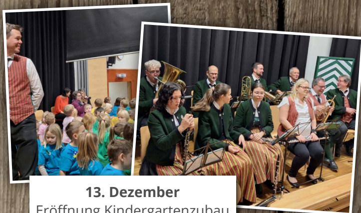
13. Dezember Eröffnung Kindergartenzubau in Oberbergern