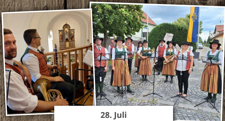
28. Juli Messe und Frührschoppen 100 Jahre ÖKB Bergern